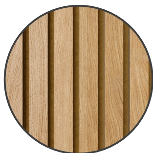
EUROPÄISCHE EICHE ECHTHOLZFURNIER