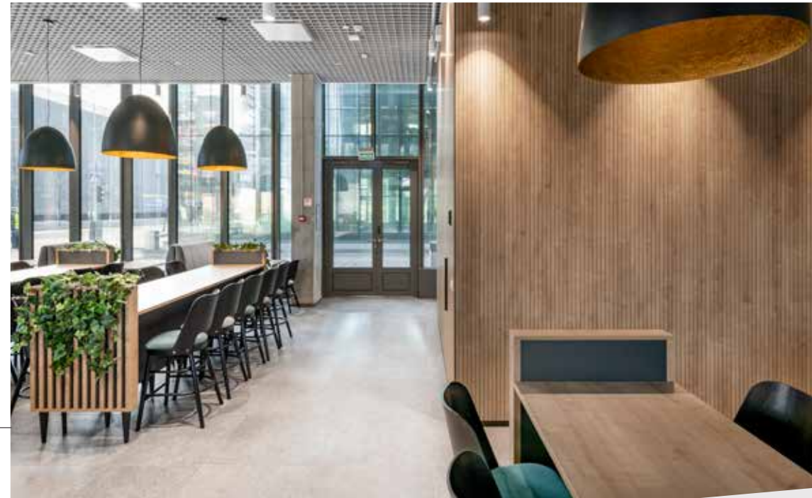
Restaurantbereich mit akustisch wirksamer Wandverkleidung.