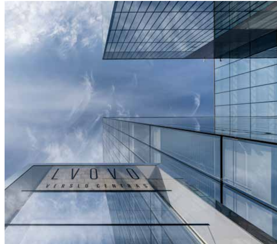
Blick hinauf auf die spektakuläre Glasfassade.