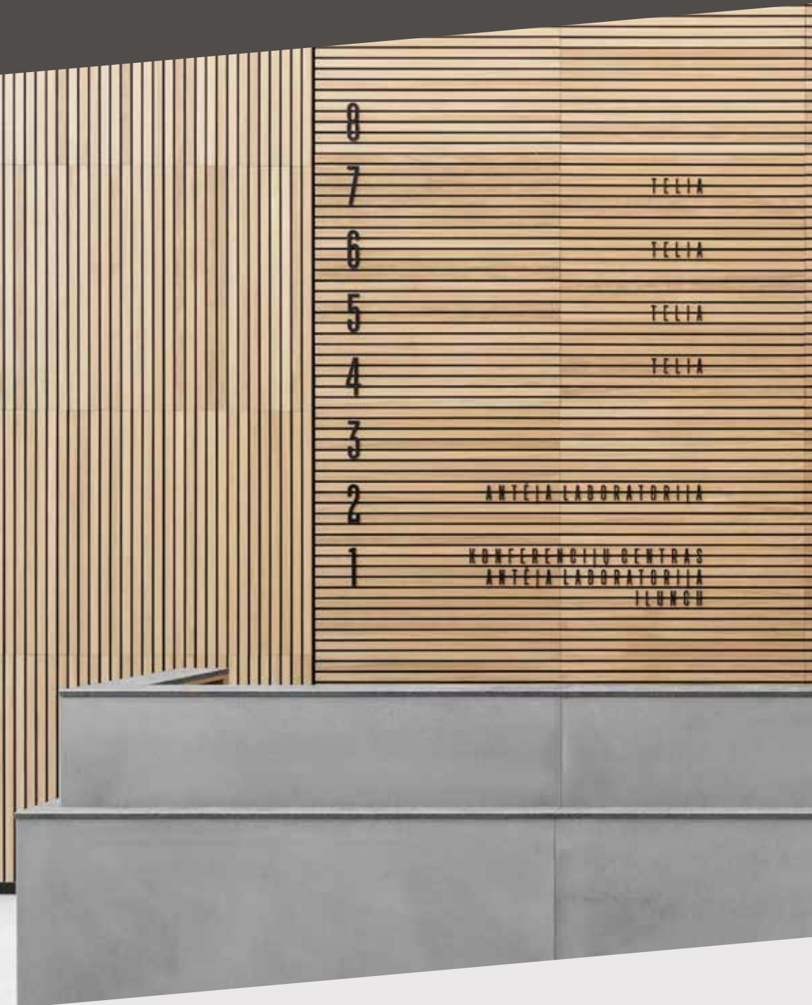
Empfangstresen mit Akustik-Ribs im Hintergrund.